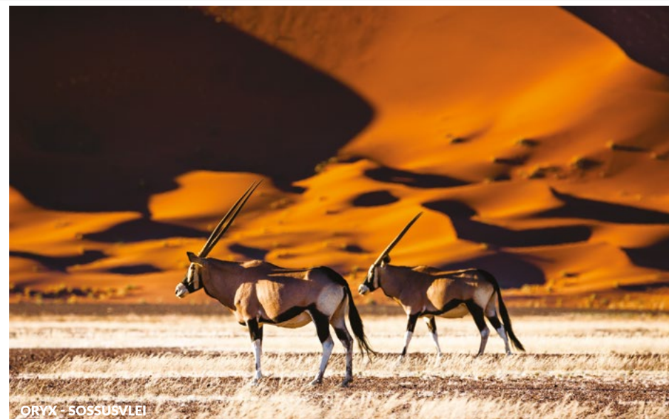
ORYX - SOSSUSVLEI