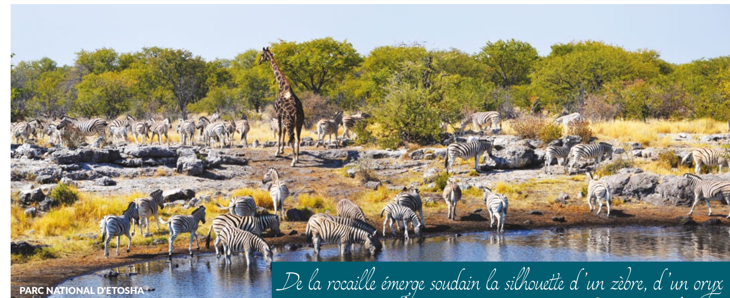
PARC NATIONAL D'ETOSHA

(1) Dates et tarifs à confirmer en janvier 2018 L'ordre des visites peut être modifié.